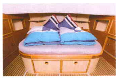
Vorschiffskabine mit Doppelbett