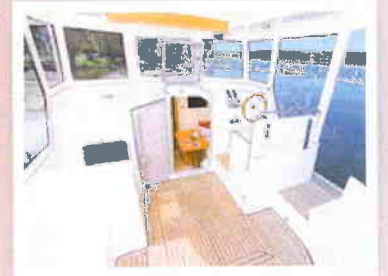
Überdachter, verschließbarer und beheizbarer Steuerstand