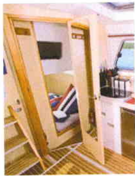
Blick in die Gästekabine